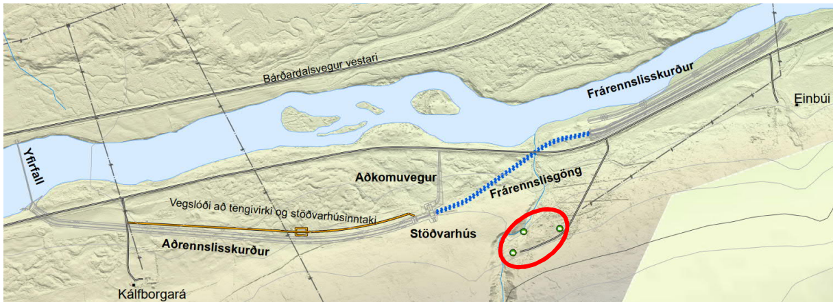
Mynd 3 Afstöðumynd Einbúavirkjunar í Bárðardal. Sýnt er hvar fyrirhugað er að staðsetja mannvirki, svo sem stöðvarhús og frárennslisgöng. Frístundabyggð við Einbúa er innan rauðusvæðisins.

Framkvæmdir vegna Einbúavirkjunar afmarkast af svæði frá yfirfalli á móts við bæinn Hlíðarenda í Bárðardal og að stað um 800 m neðan við ármótin við Kálfborgará, á móts við bæinn Einbúa. Á milli þessara staða mun aðrennslisskurður, frárennslisgöng og -skurður liggja um land bæjanna Kálfborgará og Einbúa. Stöðvarhús verður staðsett í landi Kálfborgará og frá stöðvarhúsinu verður lagður uppbyggður vegur að þjóðvegi um Bárðardal, sjá mynd 3.