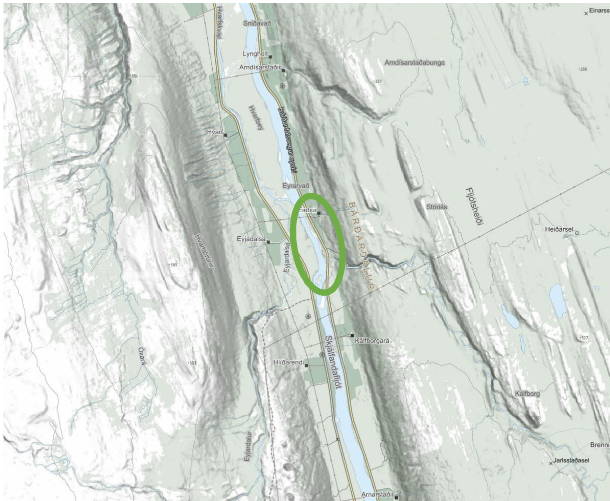
Mynd 1 Staðsetning fyrirhugaðrar virkjunar er innan grænasvæðisins

Í þessu minnisblaði er fjallað um áhrif Einbúavirkjunar í Skjálfandafljóti í Bárðardal á hávaða.